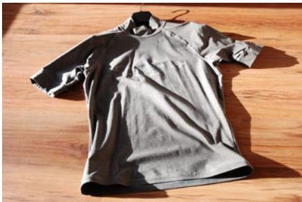
Camaro Lycra Shirt, Gr. 50/52 Anthrazit mit Blauer Schrift Neuwertig: €19,00