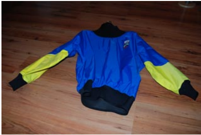
Paddeljacke/ Schutzüberjacke für Neoprenanzug Gr. 52/54 Palm, neue Manschetten. Neuwertig: VB €45,00