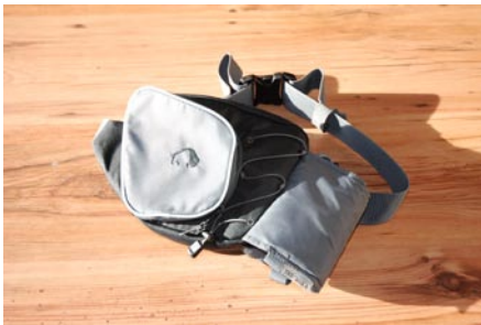
Tatonka Hip Bag, passt für alle Flaschen Neuwertig, €15,00