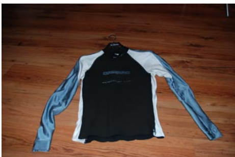
Camaro Thermoshirt Gr. 50/52 Neopren 1mm und Lycra Mix VB €29,00