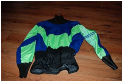
Paddeljacke/ Schutzjacke Camaro Gr. 50/52, Doppelkamin. Neuwertig VB €59,00