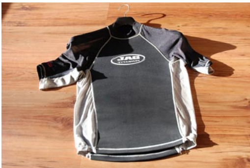
JAG Thermo Shirt Gr. 50/52 Neopren 3mm und Lycra Mix VB €15,00