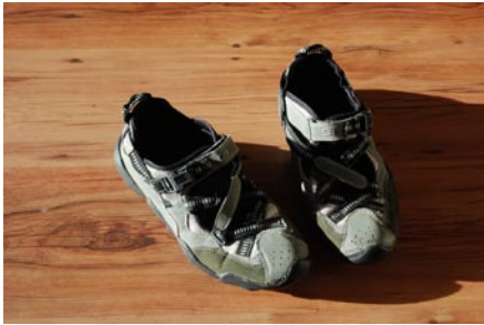
Camaro Wassersport Schuh, Gr. 41 ( Gr. 41 mit Neoprensocken!) €15,00