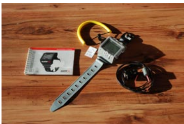
Aladin Tauchcomputer, inkl. Betriebsanleitung, Handschlaufe, und Datenkabel für PC Übertragung €90,00 Fixpreis