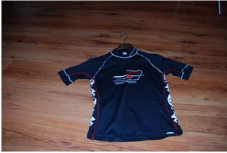
Camaro Lycra Shirt Gr. 50/52 mit Drachen auf dem Rücken VB €15,00